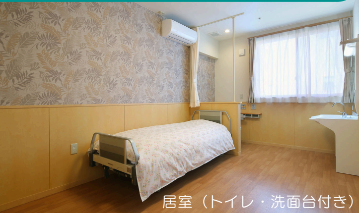
居室 (トイレ・洗面台付き)

家庭的で落ち着いた環境の中で、スタッフが24時間体制で見守りを行い、ご利用者様一人ひとりに寄り添った支援を提供いたします。